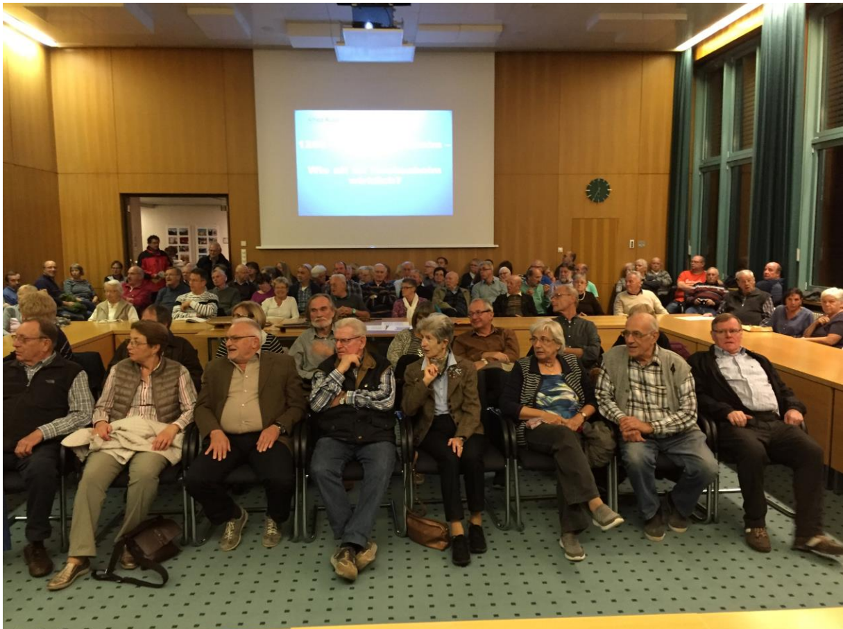
Der Bürgersaal konnte nicht alle Besucher aufnehmen