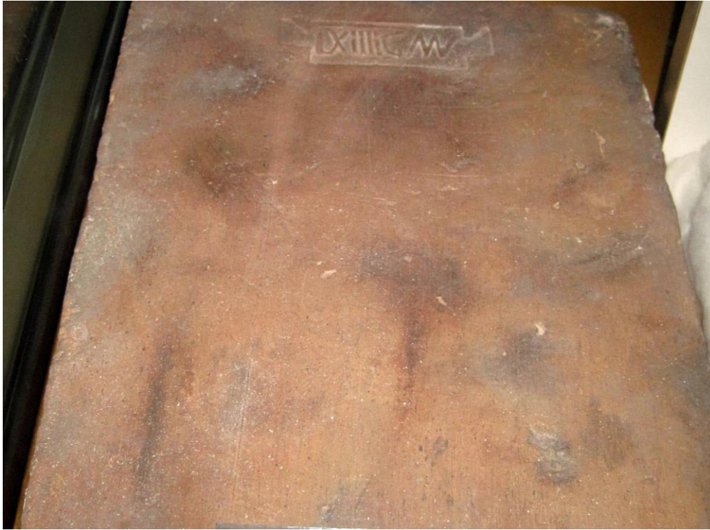
Römischer Ziegelstein mit der Prägung „LXIII GMV“ aus dem 1. Jh. n. Chr.